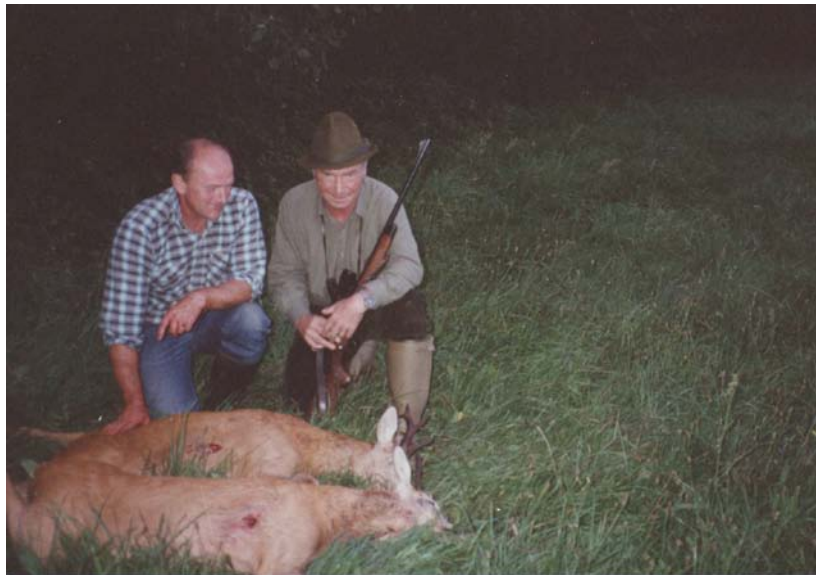
Wyniki wieczornego wyjazdu