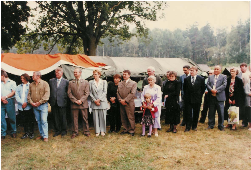
Uczestnicy obchodów 50 lecia Koła