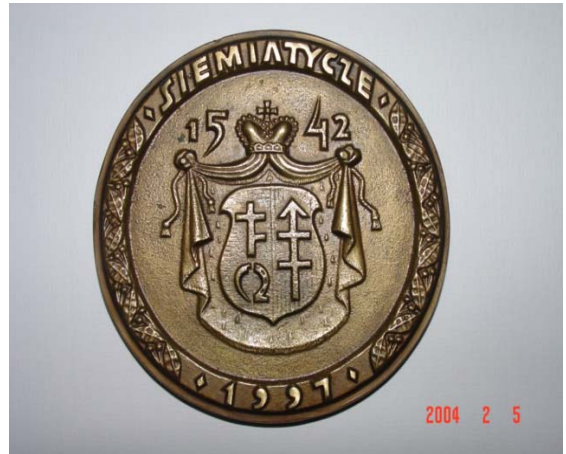
Medal ufundowany na okoliczność 50 lecia Koła KUNA